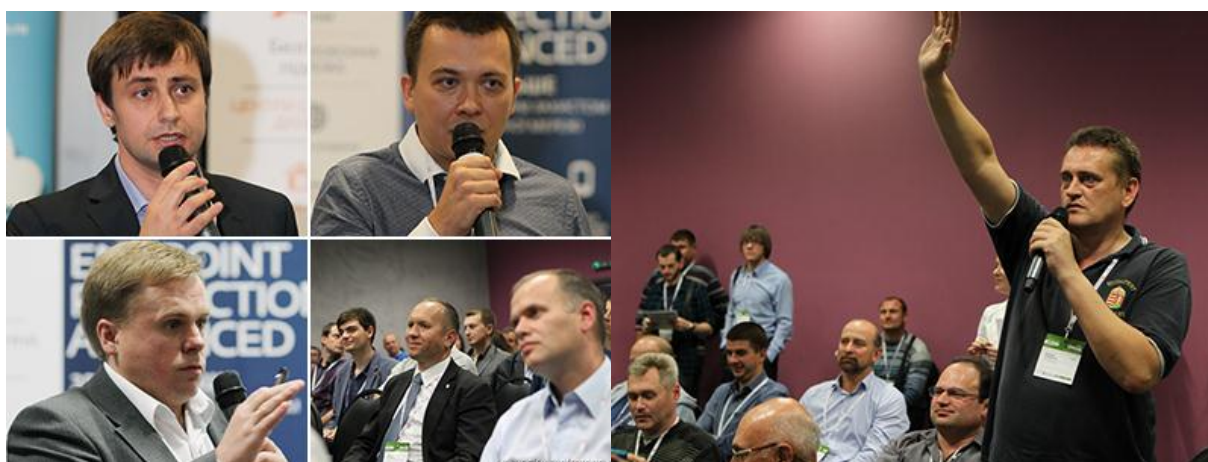
Проблематика, поднятая спикерами, вызвала оживленные дискуссии

После завершения основной программы среди посетителей Форума был проведен розыгрыш ценных призов от партнеров Grand-2015. В качестве главного приза выступала экшн-камера GoPro Hero 4! В конце мероприятия всех слушателей ждал фуршет, живое общение с коллегами и настоящая пивная вечеринка.