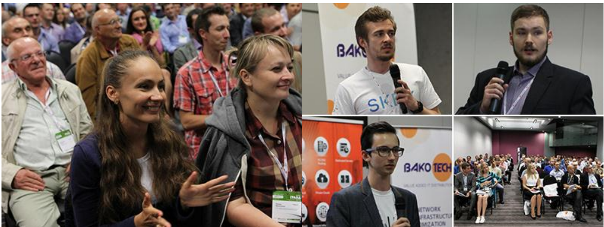
Посетители отметили не только высокую информативность докладов, но и отличную подачу