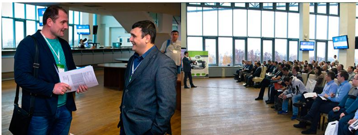
Міжнародний Форум ВІТ-2016 у Львові зібрав 188 учасників

Форум являє собою зручний майданчик для комунікацій , що об'єднує найбільш ініціативних представників вітчизняного ринку інформаційних технологій та телекомунікацій. Відзначимо, що в цьому році Форум відвідали 188 учасників!